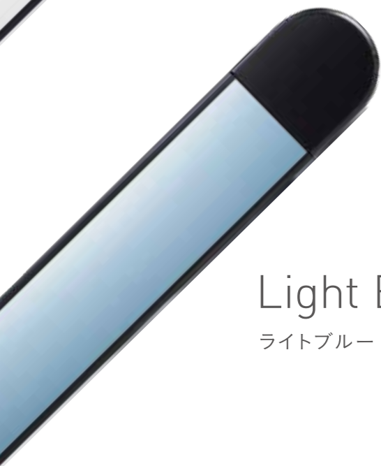
Light Blue ライトブルー