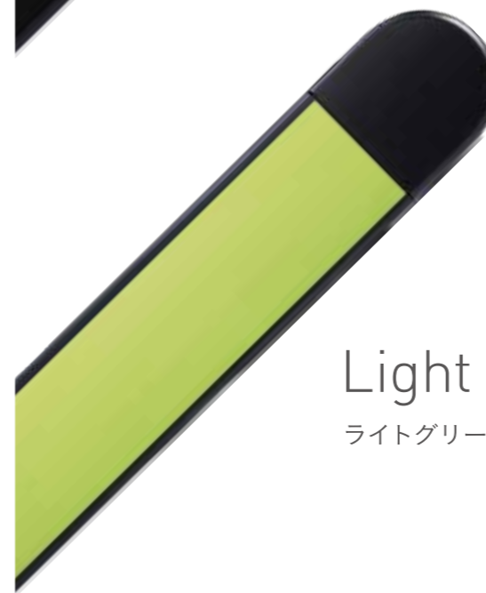
Light Green ライトグリーン