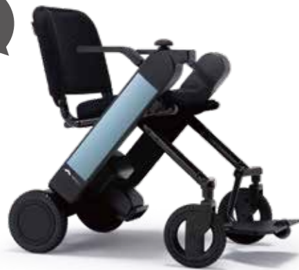
機体 カラー:ライトブルーのみ